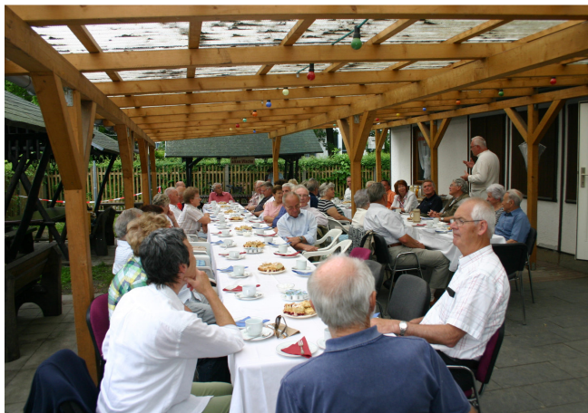
In gespannter Erwartung des Kommenden